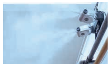
A levegő párasítók biztosítják a zavartalan termelést