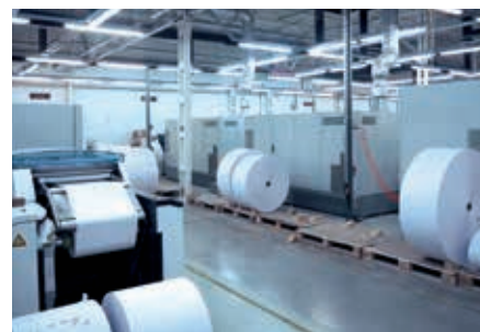
Az EPDB számlák nyomtatására szakosodott

A DRAABE TurboFog Neo rendszer 2019 óta van használatban. A Magyar Postához tartozó cég számára a költségsökkentés és a minőségbiztosítás a szabályozott páratartalom legfőbb előnyei.