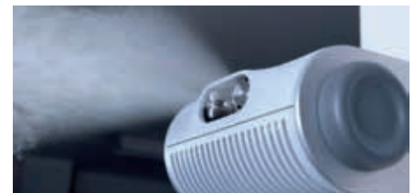
A nagynyomású fűvőkás levegő párasítók kevés karbantartást igényelnek, és kevés energiát fogyasztanak

Condair Systems GmbH Nordportbogen 5 22848 Norderstedt Németország Phone: +49 40 853277-0 Fax: +49 40 853277-44 E-Mail: info@condair-systems.hu Internet: www.condair-systems.hu